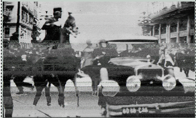
Атентат у Марсељу