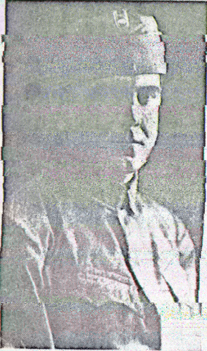
Ustaški Poglavnik Dr. Ante Pavelić vođa hrvatskog oslobodilačkog pokreta.